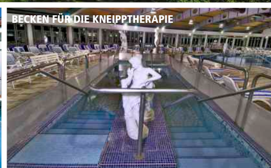
BECKEN FÜR DIE KNEIPP THERAPIE