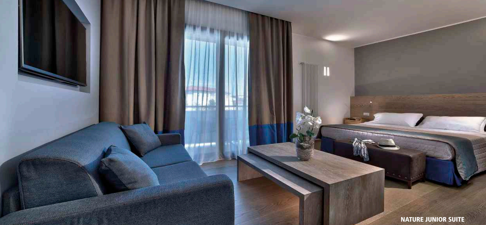
NATURE JUNIOR SUITE