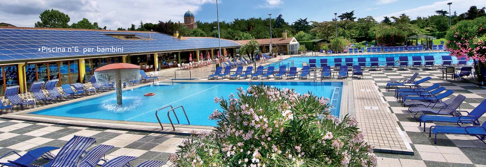
►Piscina n°6 per bambini