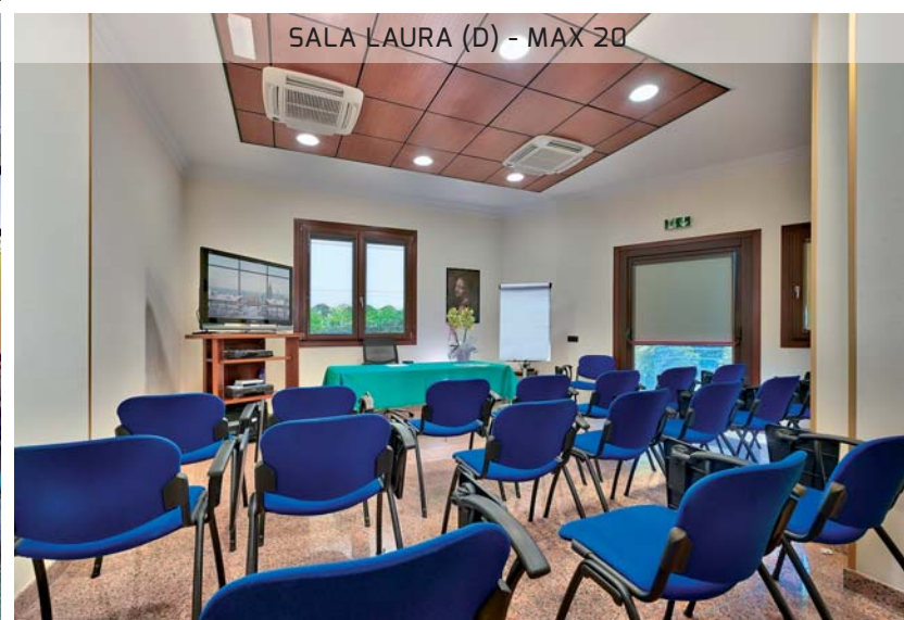
SALA LAURA (D) - MAX 20