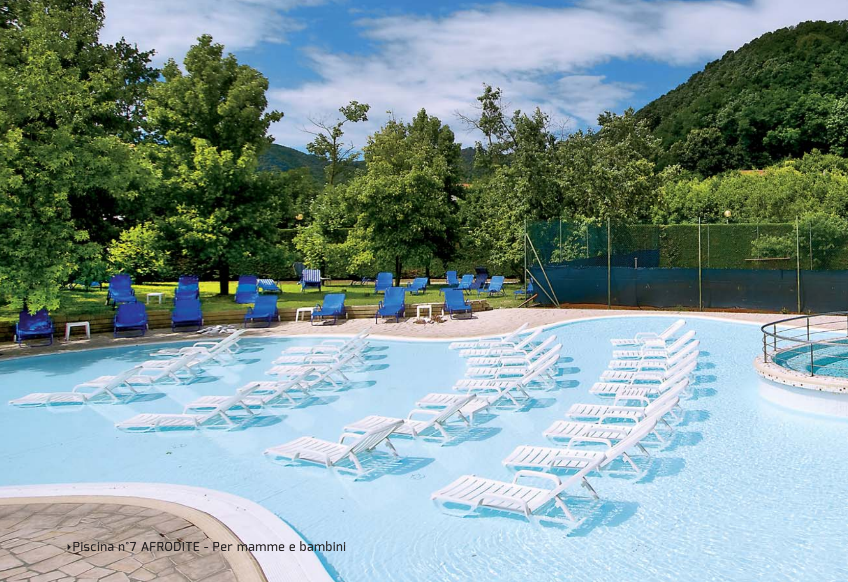
►Piscina n°7 AFRODITE - Per mamme e bambini