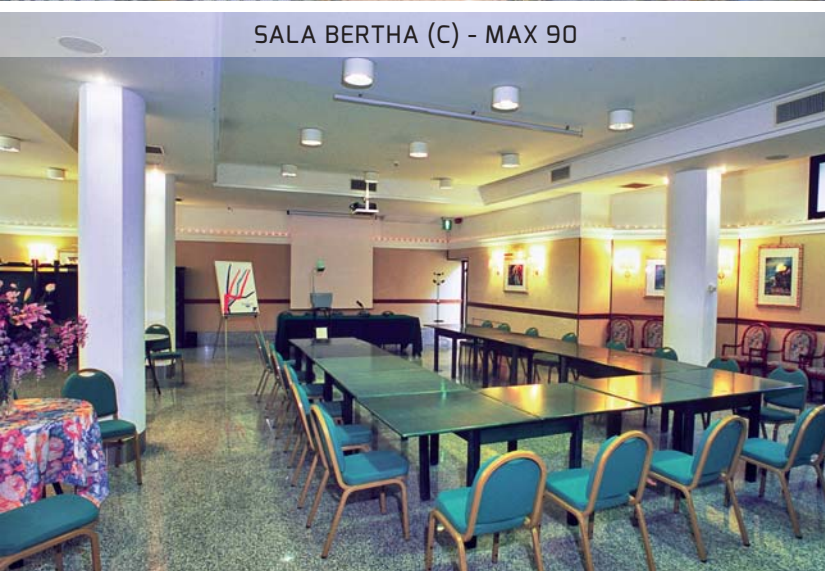
SALA BERTHA (C) - MAX 90