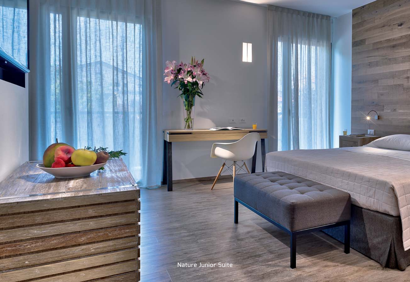
Nature Junior Suite