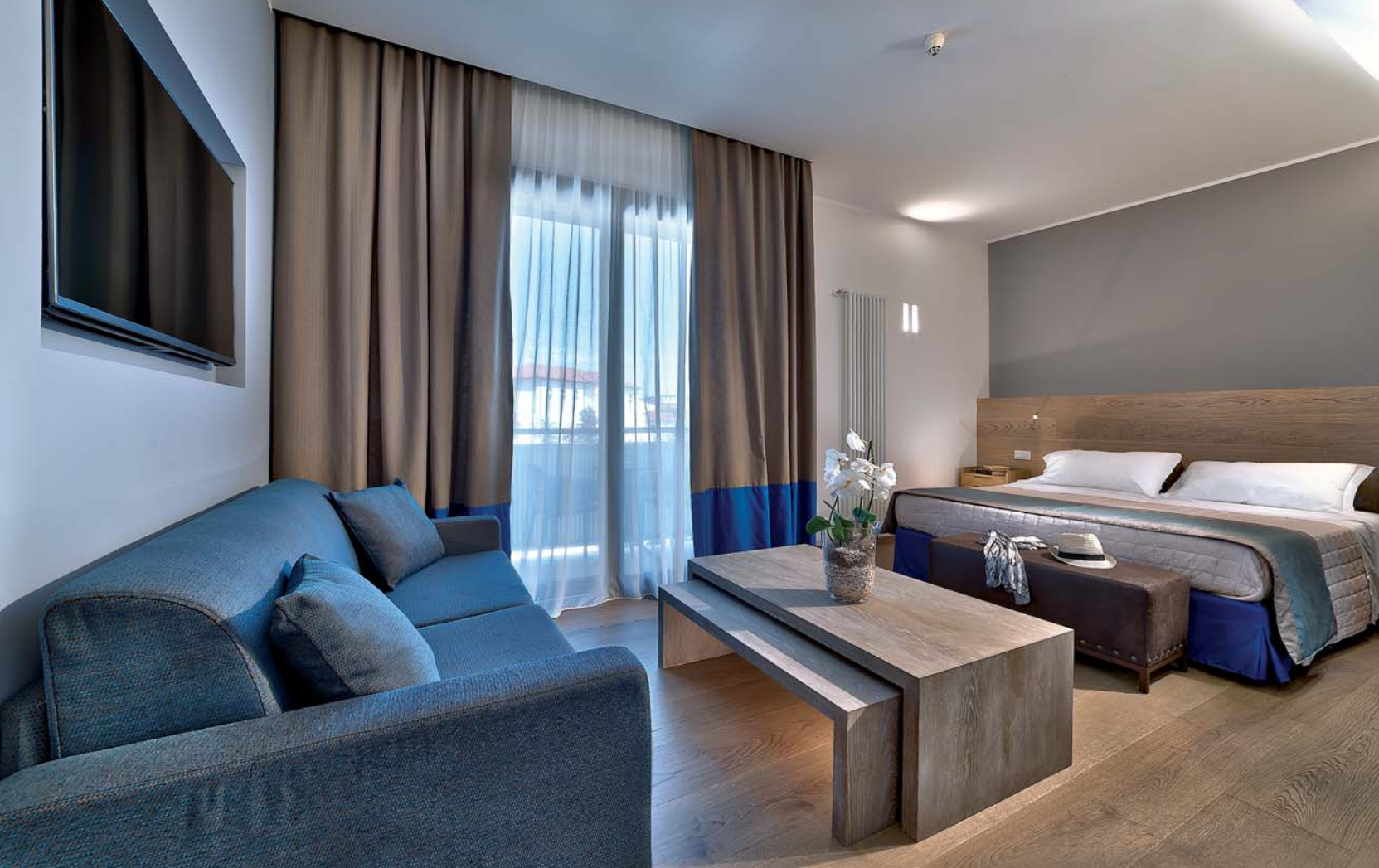
Nature Junior Suite