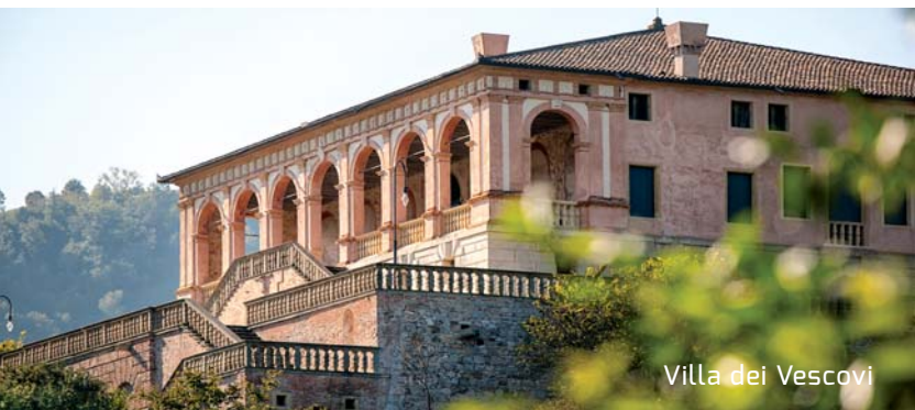
Villa dei Vescovi