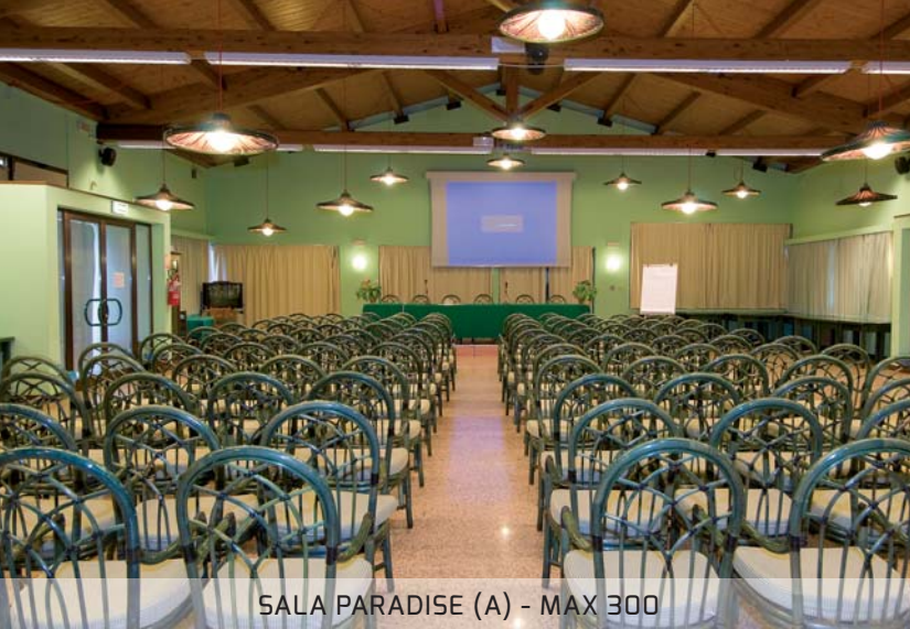
SALA PARADISE (A) - MAX 300