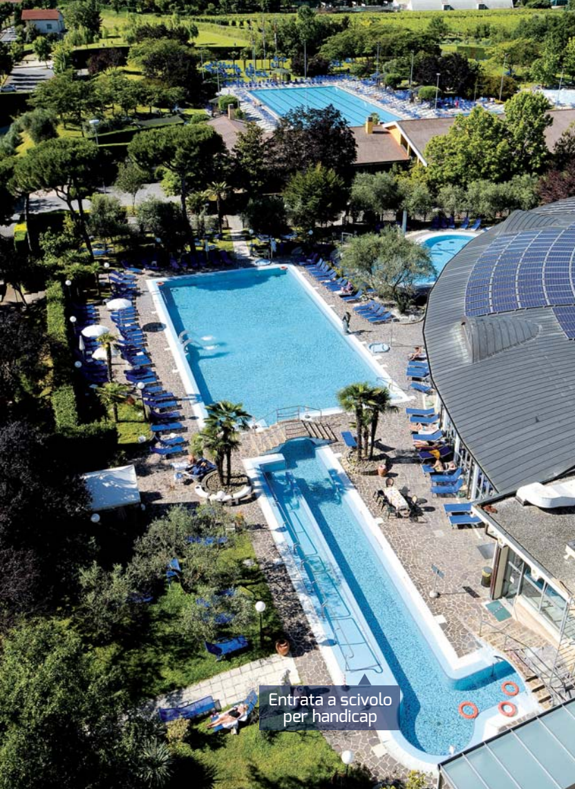
Entrata a scivolo per handicap