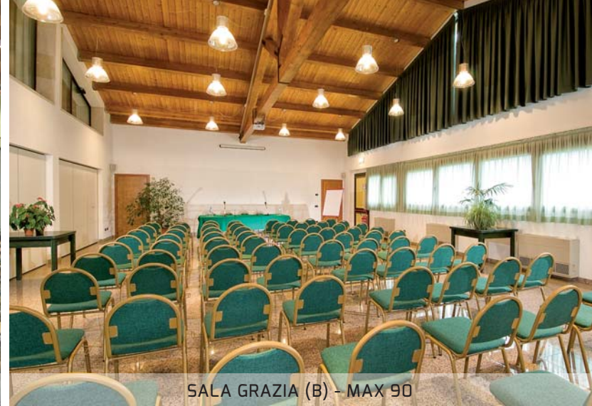
SALA GRAZIA (B) - MAX 90