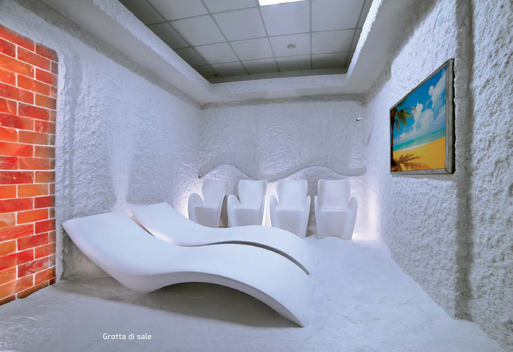
Grotta di sale