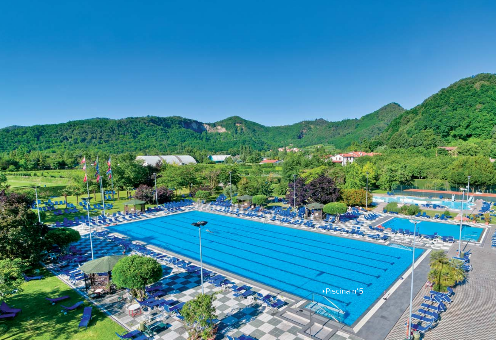
► Piscina n°5