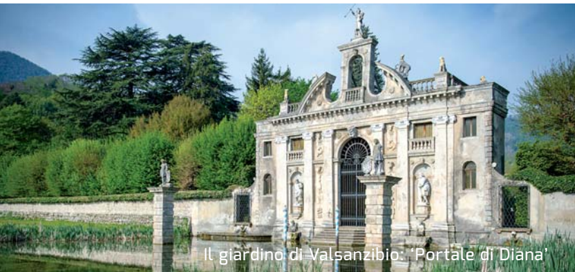
Il giardino di Valsanzibio: 'Portale di Diana'